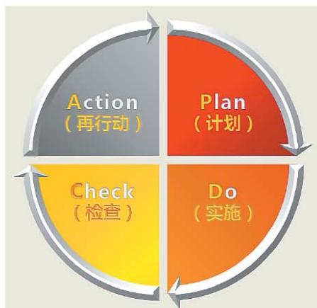
东粮集团 PDCA 管理循环

2011年10月28日，作为东粮集团五常米业的一名新进员工，我有幸参加了为期三天的《质量管理体系培训》讲座，这是一期关于在企业内部建立质量管理体系的专题培训。第一次接受全面、细致的“精益化管理”理念学习，我收获颇丰。尤其黑龙江省质量认证专家耐心讲解“PDCA管理循环”，激发了我对企业管理的深入思考。