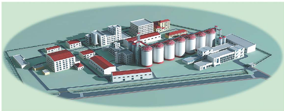
五常年50万吨稻谷加工核心园区（包括尚志、延寿、榆树、舒兰）

展望新的一年，五常园区人要不断学习东方人的优秀思想和品德、发扬爱岗爱业精神，多为企业发展着想，以饱满的热情迎接充满希望的2012年，在新的一年里，继续发扬优良传统，努力拼搏进取，为展现东方人的良好精神风貌添砖加瓦。