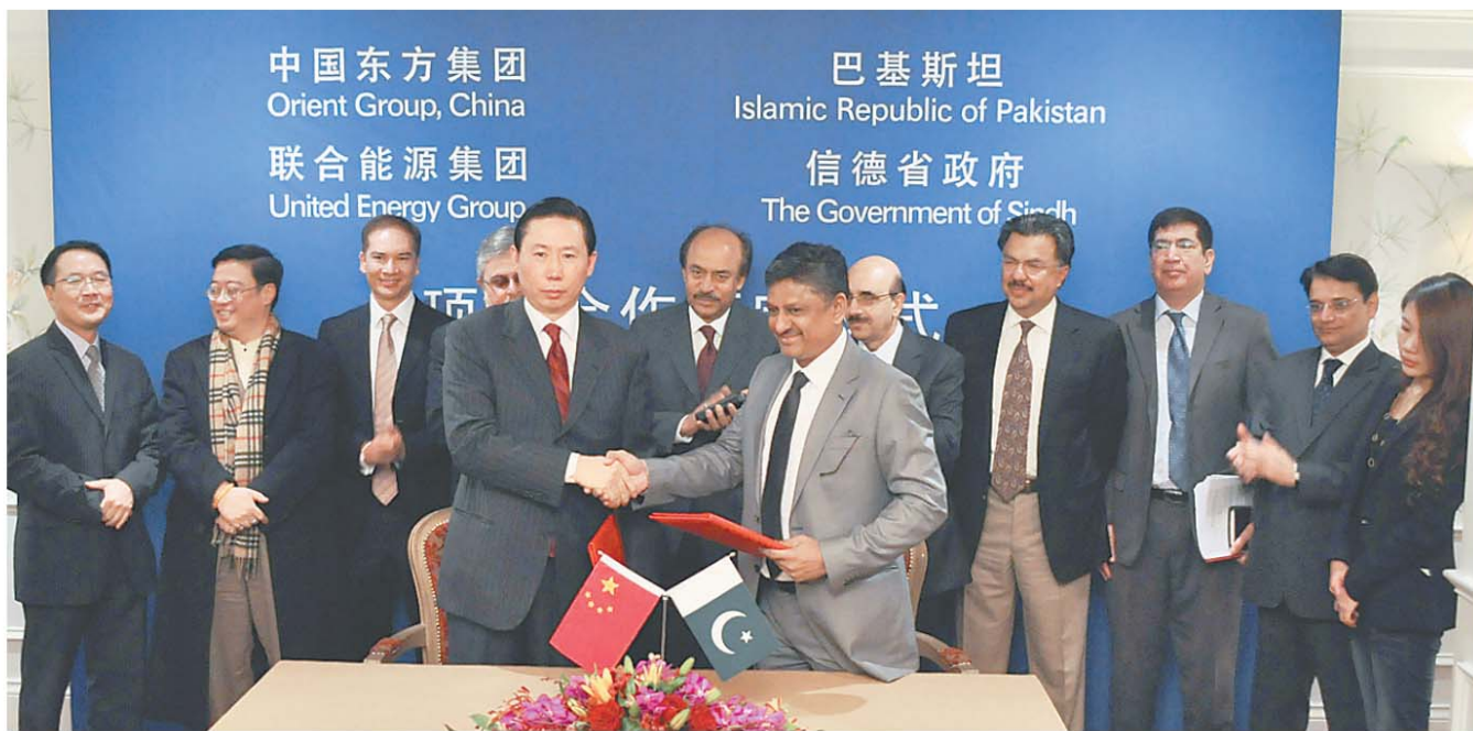
东方集团、联合能源董事局主席张宏伟与巴基斯坦信德省省长尼萨尔签署谅解备忘录