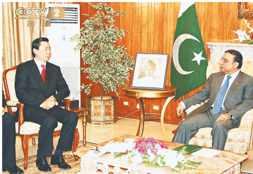
■ 2011年6月17日,巴基斯坦总统扎尔达里与到访的东方集团董事局主席张宏伟亲切交谈。