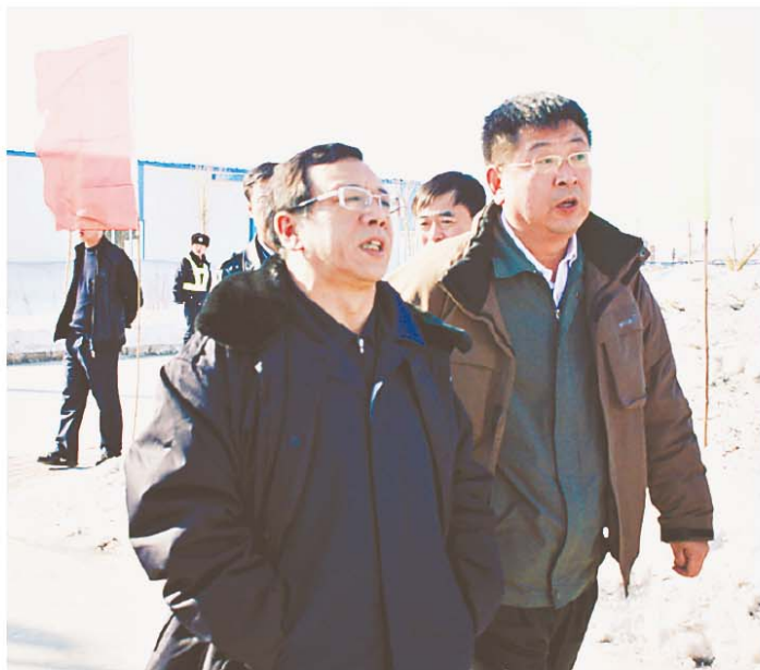
辛赵升陪同哈尔滨市书记盖如垠视察方正园区