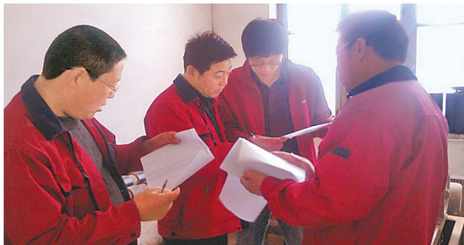
赤峰银海金业有限责任公司盘点固定资产

5月29日，黑龙江省银监局综合处、信息科技处领导到财务公司检查指导信息科技工作，听取了财务公司信息科技工作汇报。就财务公司在系统建设、信息安全、信息科技风险、信息科技制度建设等方面工作进行了深入了解，并参观了计算机机房。银监局领导对财务公司在信息安全、信息科技风险控制方面所做的工作给予了肯定，认为财务公司机房建设已经达到了国家相关标准要求。（刘冠军）