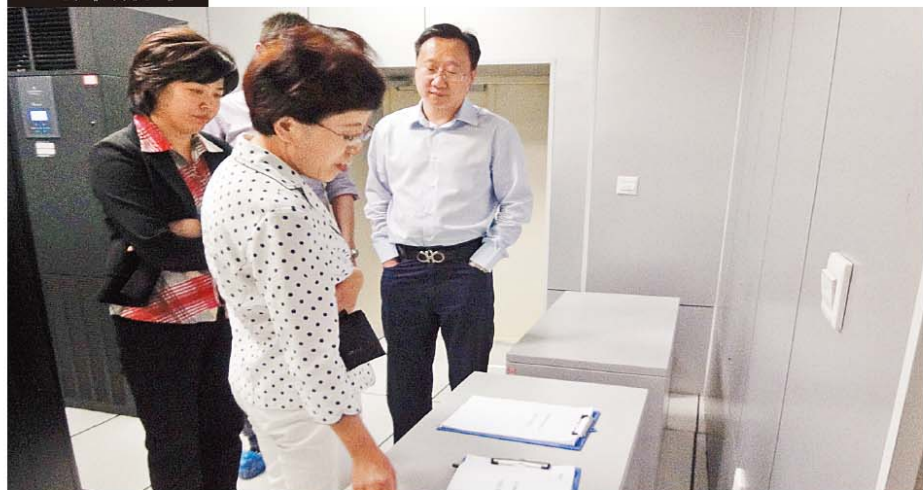
黑龙江省银监局领导检查财务公司信息科技工作

5月29日，黑龙江省银监局综合处、信息科技处领导到财务公司检查指导信息科技工作，听取了财务公司信息科技工作汇报。就财务公司在系统建设、信息安全、信息科技风险、信息科技制度建设等方面工作进行了深入了解，并参观了计算机机房。银监局领导对财务公司在信息安全、信息科技风险控制方面所做的工作给予了肯定，认为财务公司机房建设已经达到了国家相关标准要求。（刘冠军）