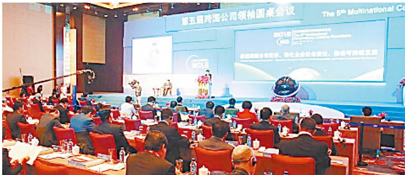
第五届跨国公司领袖圆桌会议召开现场