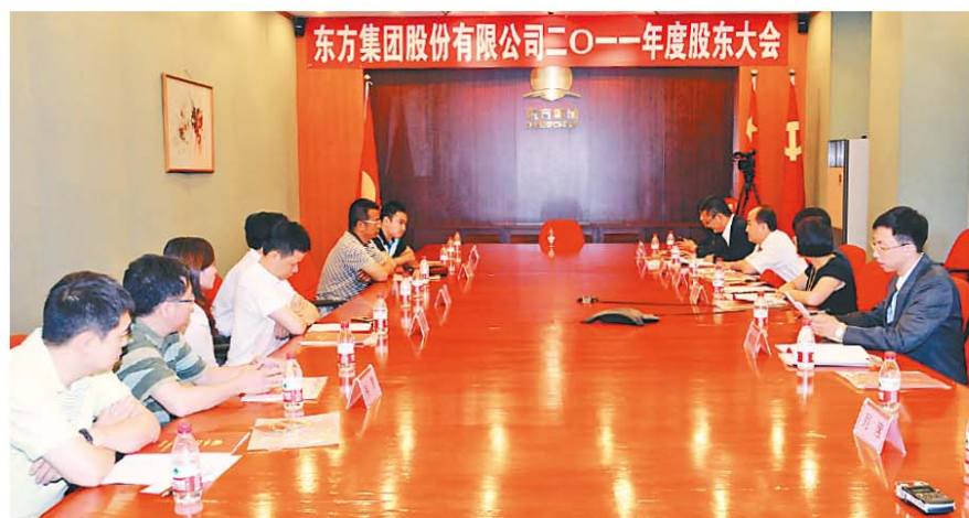
东方集团股份有限公司2011年度股东大会现场

本次会议审议并通过了以下十项议案：公司《2011年度董事会工作报告》、《2011年度监事会工作报告》、《2011年度财务决算报告》、《2011年度利润分配方案》、《2011年年度报告及摘要》、《关于续聘会计师事务所及支付审计费用的议案》、《关于变更独立董事的议案》、《关于确定公司2012年度非独立董事、监事薪酬方案的议案》、《关于为子公司提供担保额度的议案》以及《关于公司与东方集团财务有限责任公司