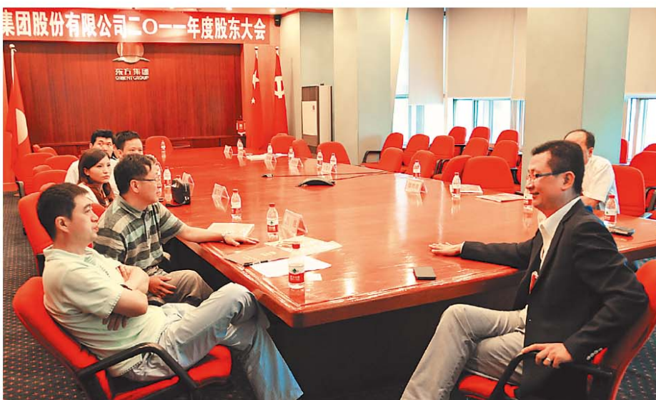
公司高管和与会股东现场交流