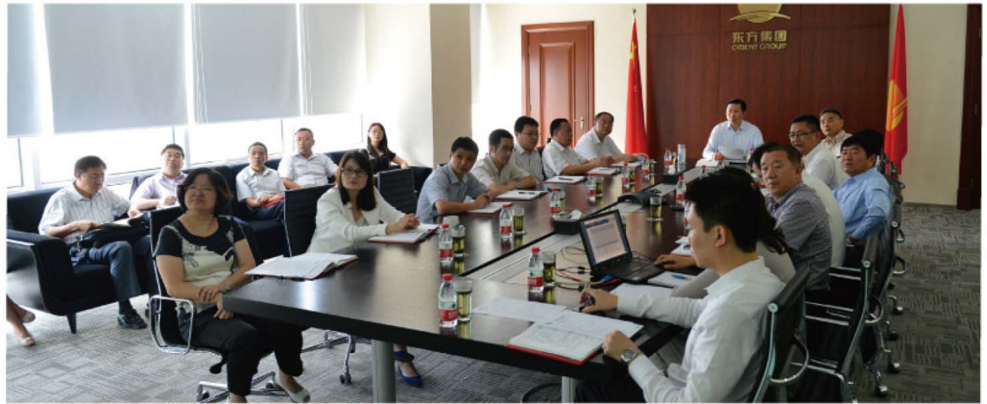
东方集团2012年年中工作会议现场

重，相互协调支持。加强公司班子建设、队伍建设、制度建设，健全公司管理体系，完善各项管理制度。重点落实赤峰、彭泽、东合三个矿山的的具体工作，在现有基础上，最大程度实现增产、增效，降低成本，提高效益。