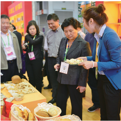
结识新的合作伙伴

省建三江农垦金三江粮油工贸有限公司等经销合作伙伴签订了291万吨原粮购销合作意向协议；东方粮仓稻谷产业有限公司与深圳华润五丰集团、江苏将军山国家粮食储备库、深圳贾稼福商贸有限公司三家合作单位签订了28万吨稻米加工销售意向协议。一系列协议的达成标志着全国粮食行业和广大消费者对东方粮仓的高度认可。展会期间，东方粮仓销售有限公司签订了有机绿色食品代理合同11家。