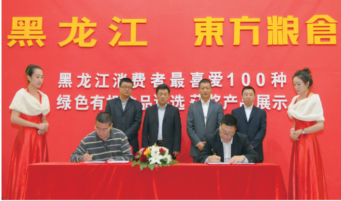
东方粮仓销售有限公司与经销商签订方香米销售合作协议